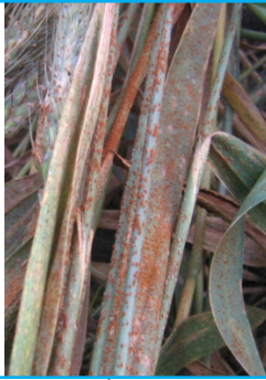
الصدأ الأسود على الأوراق