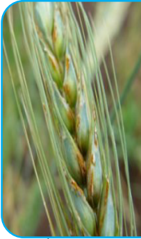
الصدأ الأسود على السنبل

تظهر الإصابة أواخر أبريل وخلال مايو على هيئة بثرات (بقع) مسحوقية مائلة للاستطالة لونها بني داكن أو مسود غير منتظمة، وقد تلتحم مع بعضها، وتظهر الإصابة على الساق وعلى سطحي الورقة والسنابل، وتسبب الإصابة الشديدة تهتك في الأنسجة الدعامية والناقلة في ساق النبات، وقد تسبب رقاد النباتات وضعف المحصول، ويناسب المرض درجات الحرارة العالية نوعاً، من ٢٥ إلى ٣٠ درجة مئوية، مع الرطوبة العالية. ولا يمثل المص خطورة نظراً لتبكير جميع الأصناف.