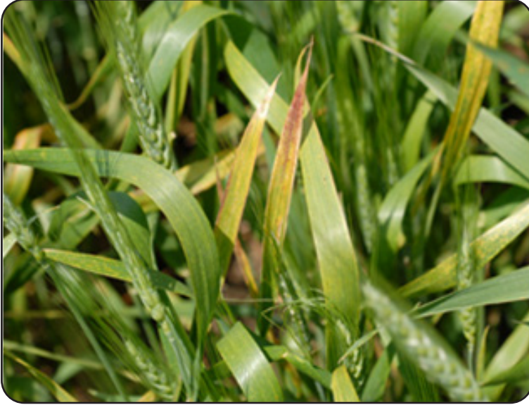
أعراض مرض فيروس تقزم الشعير الأصفر على القمح

تتم مكافحة بتطبيق حزمة التوصيات الفنية الموصى بها في زراعة القمح، خاصة معدلات التقاوي والتسميد الأزوتي والري، ويكافح المرض بنفس مبيدات مكافحة الأصداء وبنفس المعدلات عند ظهور المرض بشدة وقبل طرد السنابل.