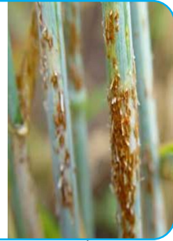
الصدأ الأسود على الساق